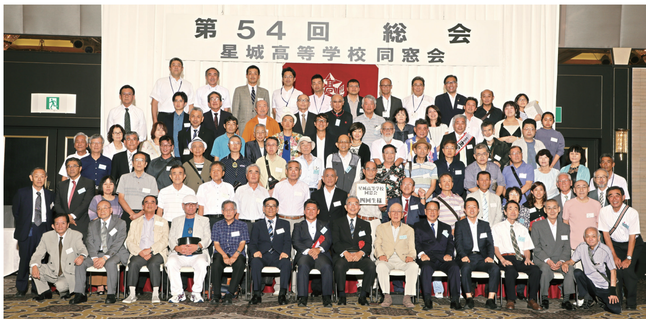
昨年の総会集合写真

第55回星城高等学校同窓会総会を心待ちにして見える同窓生の皆様方には誠に申し訳ありませんが、昨今の新型コロナウイルスの状況を鑑みて6月20日開催の役員会で中止と決定させていただきました。併せて『あれから50年』と題しました第五回卒業生の会も中止とさせていただきます。